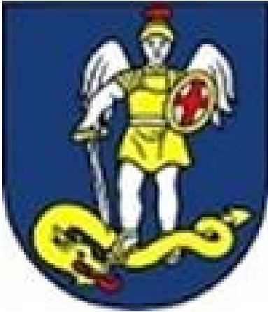
Erb obce Porúbka